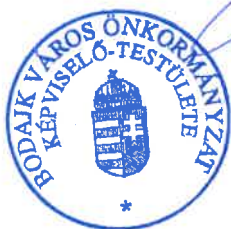
Wurczinger Lóránt polgármester