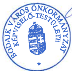
Wurczinger Lóránt polgármester