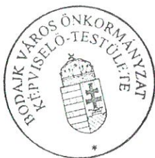
Wurzinger Lóránt polgármester