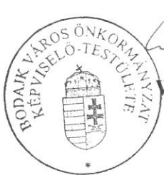
Wurzinger Lóránt polgármester