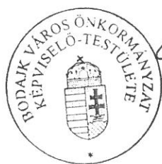
Wurzinger Lóránt polgármester